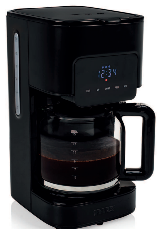
Black Steel Coffee Maker 01.246014.01.001

PARTS DESCRIPTION / ONDERDELENBESCHRIJVING / DESCRIPTION DES PIÈCES / TEILEBESCHREIBUNG / DESCRIPCIÓN DE LAS PIEZAS / DESCRIÇÃO DOS COMPONENTES / DESCRIZIONE DELLE PARTI / BESKRIVNING AV DELAR / OPIS CZĘŚCI / POPIS SOUČÁSTI / POPIS SUČASTI / ОПИСАНИЕ ЗАПЧАСТИ