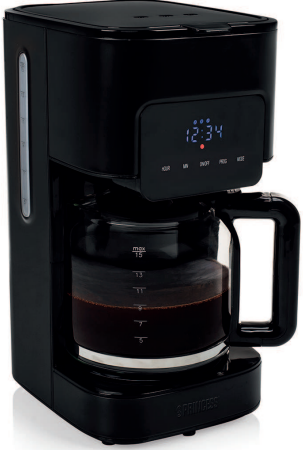
Black Steel Coffee Maker 01.246014.01.001

EN Instruction manual NL Gebruiksaanwijzing FR Mode d'emploi DE Bedienungsanleitung ES Manual de usuario PT Manual de utilizador IT Manuale utente SV Bruksanvisning PL Instrukcja obsługi CS Návod na použití SK Návod na použitie RU Руководство по эксплуатации